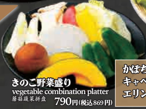
きのこ野菜盛り vegetable combination platter 蘑菇蔬菜拼盘 790円(税込869円)