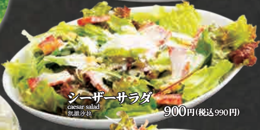
シーザーサラダ caesar salad 凯撒沙拉 900円(税込990円)