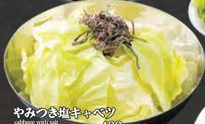
やみつき塩キャベツ cabbage with salt 盐卷心菜 400円(税込440円)