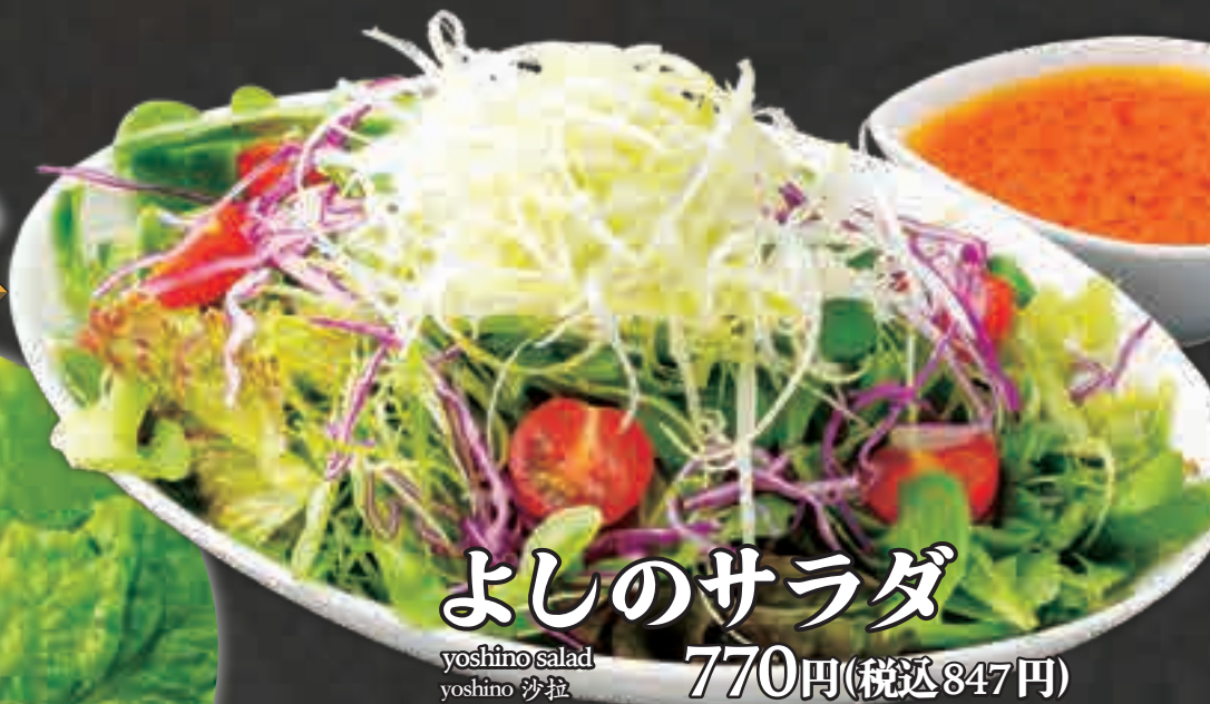
よしのサラダ yoshino salad yoshino 沙拉 770円(税込847円)