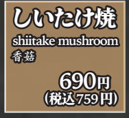
しいたけ焼 shiitake mushroom 香菇 690円(税込759円)