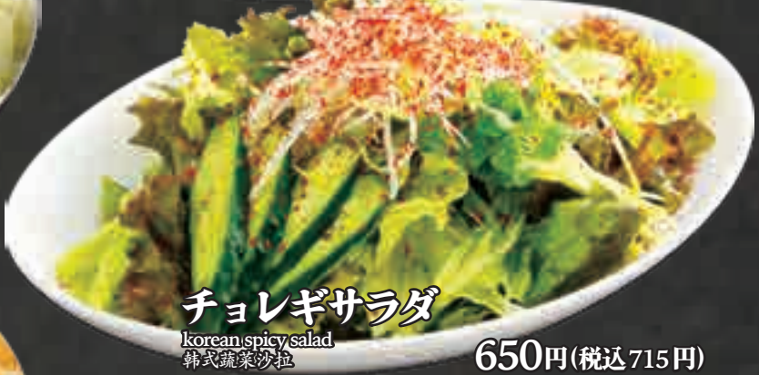
チョレギサラダ korean spicy salad 韩式蔬菜沙拉 650円(税込715円)