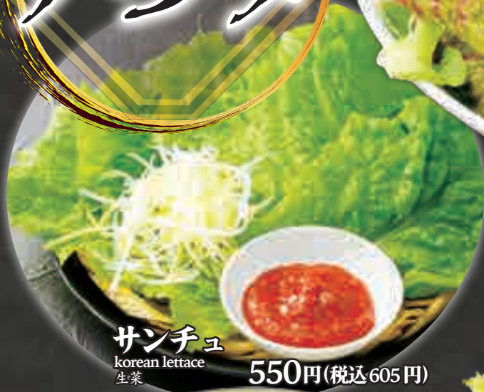
サンチュ korean lettuce 生菜 550円(税込605円)