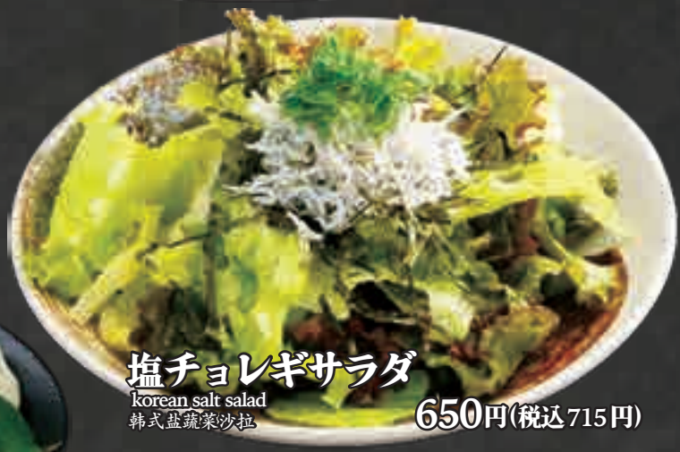
塩チョレギサラダ korean salt salad 韩式盐蔬菜沙拉 650円(税込715円)