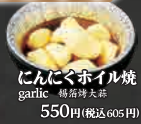
んにくホイル焼 garlic 锡箔烤大蒜 550円(税込605円)