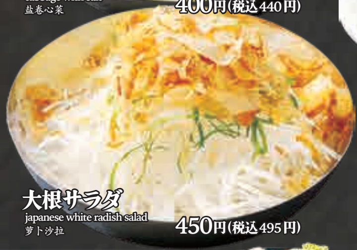
大根サラダ japanese white radish salad 萝卜沙拉 450円(税込495円)